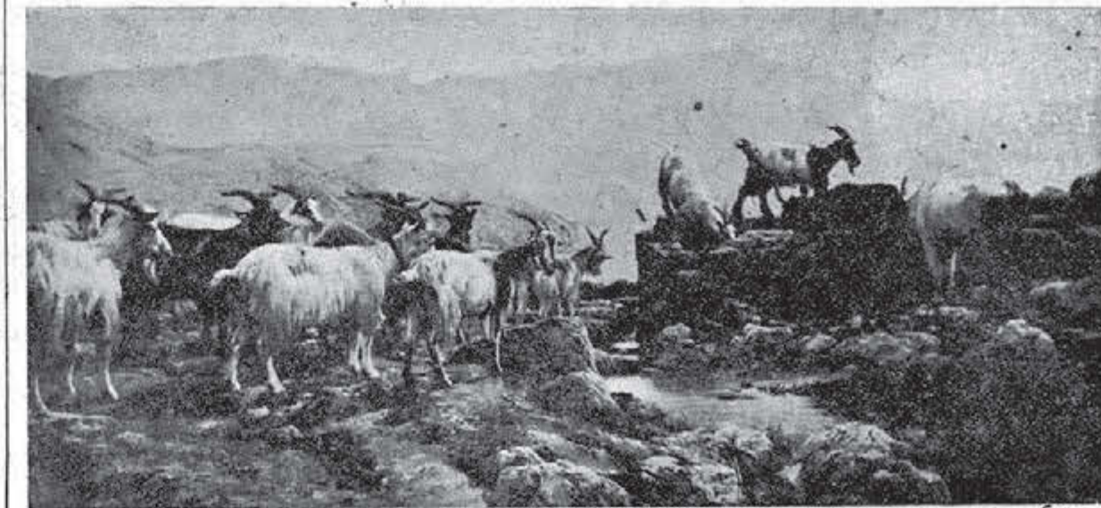
Fontanille de la Ficciola

Hallándose el año pasado en París una alta dama de Rusia, fué a casa de uno de los más célebres modistos y encargó un magnífico sombrero, que debía ser entregado ocho días después en el hotel donde se hospedaba la señora. Pero ésta tuvo que salir precipitadamente para Berlín para ver a una amiga que había caído gravemente enferma, y cuando llevaron el sombrero al hotel lo expidieron a la capital del imperio alemán, a cuyo punto llegó cuando su propietaria se había marchado a Londres. El sombrero llegó a la capital de Inglaterra en el momento en que la dama acababa de tomar el tren